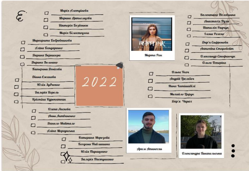
Рисунок 1. Захищені у 2022 р. бакалаврські роботи

У цьому розділі – про наших випускників, які були і є з кафедрою протягом років та десятиліть. Ми відновили багато університетських та кафедральних документів, звернулися також до наших випускників, щоб позначити кожен рік кафедри нашими добрими спільними сподадами. Починаючи з 2017 року фіксуємо кожного із наших випускників, бо це наша спільна історія, якою ми гордімося і за яку поважаємо кафедру нашого успіху. Будемо раді, якщо цю нашу спільну історію нададі твітнуватимемо разом!