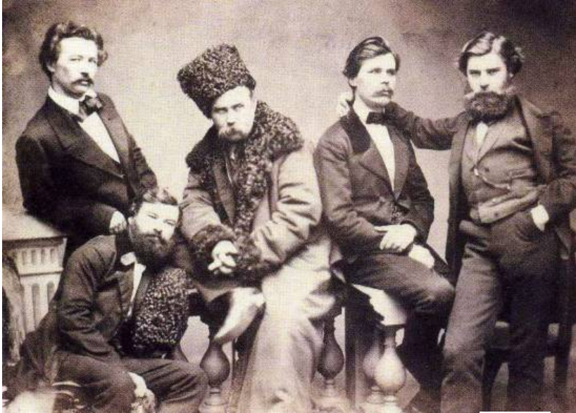
Рисунок 4. Т. Шевченко з друзями. 1859 рік.

Збереглася світлина, де Т. Шевченко сфотографований зі своїми приятелями. Є відомості, що цю групу знімав А. Деньєр (рис. 4). Найпереконливішим аргументом Деньєрського авторства є бутафорна балюстрада з характерними балясинами, якої немає на світлинах М. Досса, О. Шпаковського, К. Бергамаско, С. Левицького, жодного іншого фотографа, зате є на понад десяти світлин А. Деньєра.