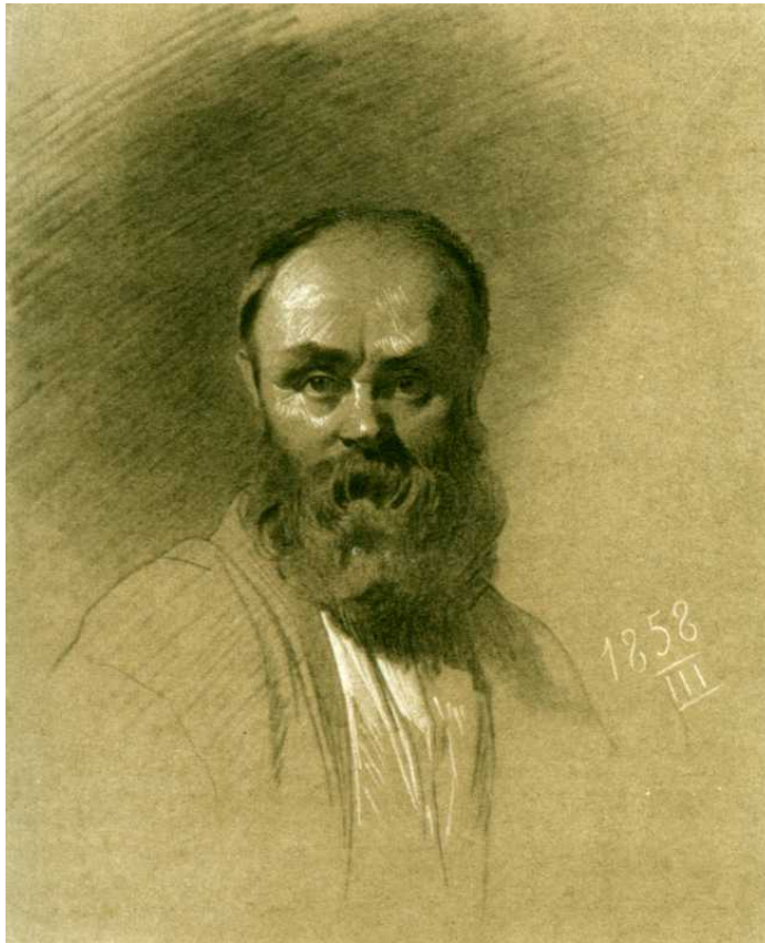
Рисунок 1. Фото автопортрета Т. Шевченка. Фотограф невідомий 1858 р.

Фотографія досить активно почала входити в ужиток у часи десятирічного Шевченкового заслання. Поет знав про її поширення з тогочасних столичних газет і журналів, котрі потрапляли і до забутого всіма Новопетровського укріплення [5]. А з Оренбурга таємно надходили сюди й самі світлини: портрети Шевченкових друзів і знімки з його власних малюнків, які митець конспіративно пересилав туди для подальшого збуту. На останньому році свого заслання поет через друзів сприяв коменданту Новопетровського укріплення в купівлі фотокамери. Однак скористатися її можливостями митцю не вдалося – камера прийшла до укріплення після його звільнення. Є думка, що першою фотографією із зображенням Т. Шевченка, яку він тримав у руках, був знімок його автопортрета 1858 р. (рис. 1)