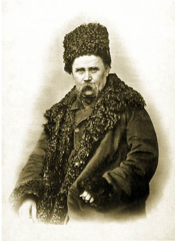
Рисунок 2. Т.Шевченко.

Фотографії, пов'язані із Т. Шевченком, стали для багатьох дослідників справою всього життя, адже в них стільки нерозгаданих таємниць. Це стосується точних дат, місць фотографування, а також самих фотографів. Наприклад, є одна фотографія, на якій зображуваного Т. Шевченка часто називають академіком. Досі вважали, що портрет виконано наприкінці 1860 р. чи навіть на початку 1861-го. Тривалий час дослідники висловлювали думку, що виконавцем світлини був петербурзький фотограф Александровський. Підстави для такої здогадки давав лист від 5 лютого 1861 р., адресований Тарасу Григоровичу літератором Василем Толбіним. У ньому, зокрема читаємо: «Наймиліший мій пане й господине Тарасе Григоровичу! Високоповажний! Уповаю, що Ваше дорогоцінне здоров'я поправилось, прошу Вас прибути у фотографію Александровського (навпроти Казанського собору) для долучення Вашого портрета до галереї російських літераторів. Уже зняті: Щербина, Розенгейм, Курочкін, Бруні, Айвазовський, Толбін. Зверніться коротко: на запрошення Толбіна в галерею російських літераторів Тарас Григорович Шевченко, і ділу край, а ви ще одержите 12 карток» [9]. Досі шевченкознавцям було відомо тільки прізвище згаданого Толбіним фотографа.